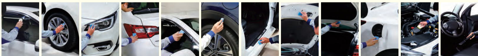
①窓ガラス全面 ②アルミホイール4本 ③ヘッドライト ④テールレンズ ⑤サイドバイザー ⑥樹脂フェンダーキーパー ⑦ドア内側のステップ部分 ⑧ボンネットの裏側 ⑨トランクの裏側 ⑩給油口の内側 ⑪エンジンルームの中 ⑫車内清掃

ボディをコーティングで守り、ボンネット・トランクの裏・ドアヒンジ・塗装してある隅々まで全てコーティングします。