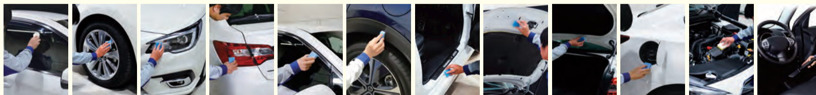
①窓ガラス全面 ②アルミホイール4本 ③ヘッドライト ④テールレンズ ⑤サイドバイザー ⑥樹脂フェンダーキーパー ⑦ドア内側のステップ部分 ⑧ボンネットの裏側 ⑨トランクの裏側 ⑩給油口の内側 ⑪エンジンルームの中 ⑫車内清掃

ボディをコーティングで守り、ボンネット・トランクの裏・ドアヒンジ・塗装してある隅々まで全てコーティングします。